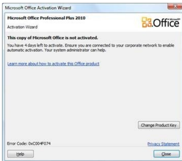
Рисунок 6 – Не активированная копия Excel

Важно! Если ваш Excel не активирован (рисунок 6), то формирование уведомлений не выполняется до тех пор, пока копия не будет активирована. Используйте компьютеры с лицензионным программным обеспечением!