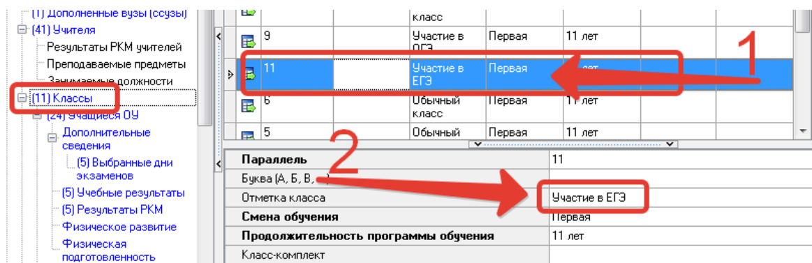
Рисунок 3 – Выбор класса

Важно! Следует проверить, что для всех классов, которые сдают ЕГЭ в поле «Отметка класса» проставлено значение «Участие в ЕГЭ» (рисунок 3, цифра 2).